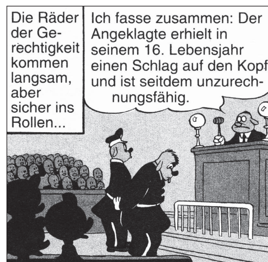
FC 108, TGDD 89

„Zündel-Karl“ dagegen, der Feuerteufel, der um ein Haar ganz Entenhausen niedergebrannt hätte, ist seit seinem 16. Lebensjahr unzurechnungsfähig. Trotzdem steht er vor Gericht.