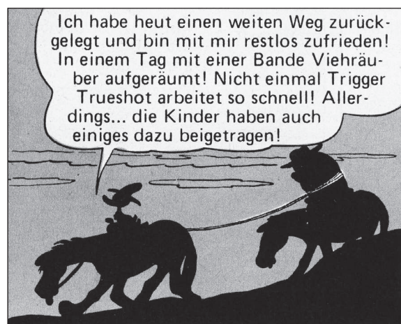
FC 199, TGDD 66

Wenn er auf seinem Schimmel im Abendrot zu Tal reitet, fühlt er sich im Einklang mit seinen historischen Wurzeln.