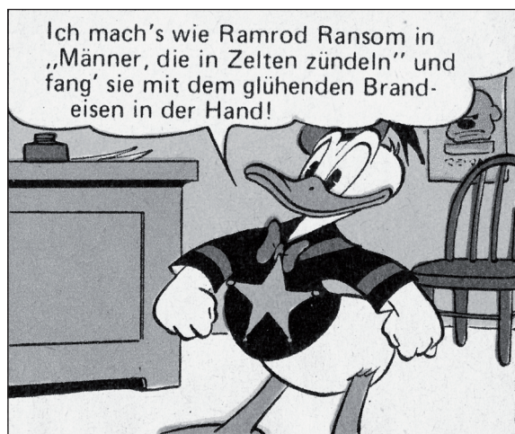
FC 199, TGDD 66

Donaldisten wissen, dass in den Berichten von Barks und Fuchs kein Bild und keine Sprechblase zufällig oder gar „ausgedacht“ ist. Jedes einzelne Bild, jede Sprechblase ist für Donaldisten wie ein winziger Spalt in der Wand der Unwissenheit, durch den sie einen Blick in die Welt von Entenhausen tun können. Ein einziges dieser Fensterchen, eine einzige Sprechblase soll hier analysiert werden: „Ich mach’s wie Ramrod Ransom in ‚Männer, die in Zelten zündeln‘ und fang’ sie mit dem glühenden Brandeisen in der Hand!“ 1