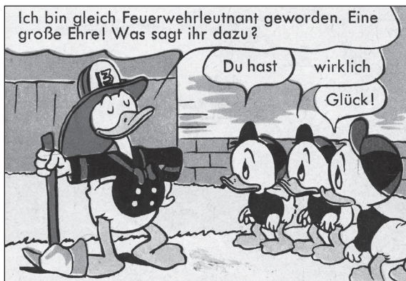
WDC 86, TGDD 10

Der Schluss liegt nahe, dass die Angst vor der zerstörerischen Macht des Feuers im Bewusstsein der Entenhausener ebenso tief verankert ist wie das Wissen um seine wohltätige Macht.