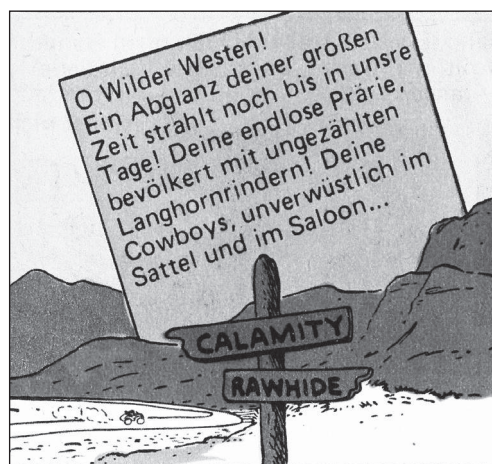
FC 199, TGDD 66

„O Wilder Westen! Ein Abglanz deiner großen Zeit strahlt noch bis in unsere Tage! ... Deine Cowboys ... Deine Desperados ... Deine wortkargen Sheriffs, die um 12 Uhr mittags in die flirrende Sonnenglut starrten, ohne sich anmerken zu lassen, ob Mut oder Furcht ihr trutzig Herz erfüllt ... vorbei, ach vorbei ...“