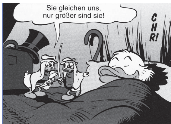
US 30, KA 50

Insbesondere Dagobert Duck lässt Bewunderung und Ehrfurcht für den bestirnten Himmel über sich kläglich vermissen. Viel lieber wäre ihm ein Zeltdach über dem Zylinder. Das Zelt, meistens in Form eines Steilwandzeltes, ist die gewöhnliche Unterkunft der Ducks auf Reisen – nicht nur beim Sommercamping im Bärenforst, sondern auch auf Geschäftsreisen, z.B. in die arabische Wüste zur Ausbeutung von 40 Ölquellen. Auch da logiert Großunternehmer Dagobert Duck, Herr über zahlreiche Zugmaschinen, riesige Rohrleger und ein Heer von Arbeitern, selbstmurmelnd im Zelt.