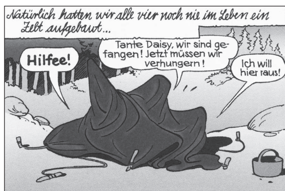
FC 1150/2, BL-DY 2

Drei Stichworte werden in dem Filmtitel genannt: MÄNNER – ZELT – ZÜNDELN.