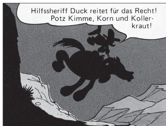
FC 199, TGDD 66

In den schaurigen Badlands jenseits der grünen Weiden von Bullet Valley hat Donald dieses Hilfsmittel allerdings nicht zur Verfügung. Da muss er sich auf seinen Colt, sein Lasso und seinen ungemein klugen Westergaul verlassen.