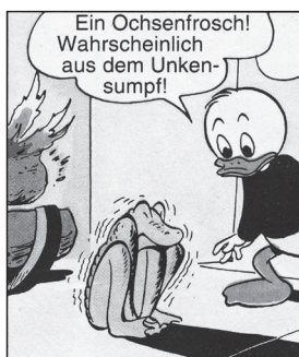
WDC 216, TGDD 99

Die Kunst, ein Feuer zu entzünden und zu unterhalten, gehört zu den Alltagsfertigkeiten der Familie Duck – und zwar nicht nur der jugendlichen Pfadfinder.