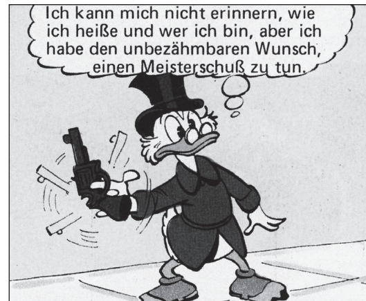
US 57, TGDD 64

Am deutlichsten zeigt sich die Überlieferung der Normen und Werte des Wilden Westens jedoch in Donald Duck.