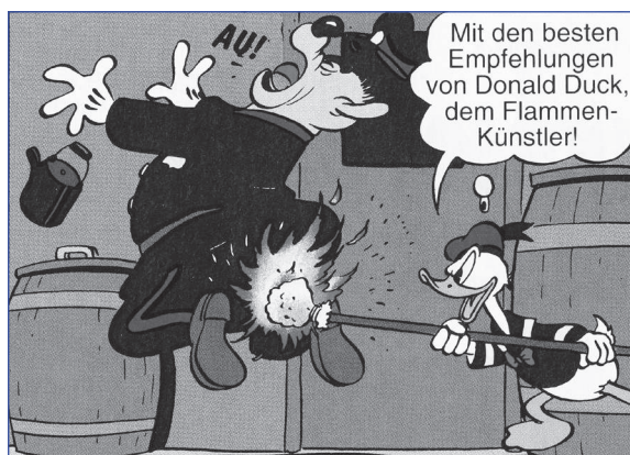
FC 108, KA 54

Ob es in „Männer, die in Zelten zündeln“ einen ähnlich dramatischen Showdown gibt, wissen wir nicht. Über die Handlung dieses Films wissen wir ja nur, dass es darin ebenfalls um Viehdiebe geht, und dass sie am Ende vom Sheriff gefasst werden. Donalds selbstbewusste Behauptung „Ich mach’s wie Ramrod Ransom und fang sie mit dem glühenden Brandeisen in der Hand“ ist sprachlich doppeldeutig. Werden die Viehdiebe gefangen, während sie noch die glühenden Eisen in der Hand halten, mit denen sie den gestohlenen Rindern ihr falsches Brandzeichen aufdrücken? Oder ist es Ramrod Ransom, der das glühende Brandeisen in der Hand hält? Die Barks’sche Textüberlieferung ist eindeutig: „I’ll do it like Ramrod Ransom did in ‚Gunfire on the Rio‘! I’ll catch ‘em with their brandin’ irons in the fire!“ Aber hier ist auch von „Gunfire on the Rio“ die Rede und nicht von „Männer, die in Zelten zündeln“. Nach dem Fuchs-Text ist auch die andere Deutung möglich.