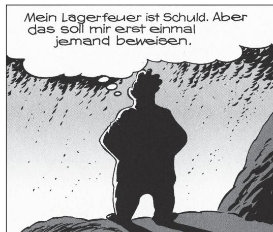
VP 1, BL-DO 18

Verständlich, dass Brandstifter in Entenhausen ganz besonders übel angesehene Gesellen sind.