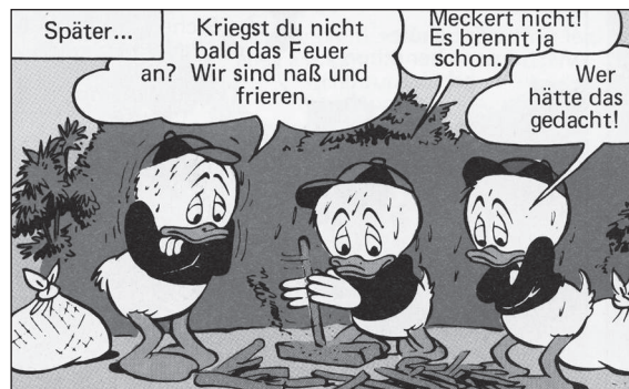
WDC 169, KA 19

Die junge Generation steht ihm darin nicht nach. Zur Grundausbildung der Fieselschweiflinge gehört die Fertigkeit, ein Feuer durch Reibungshitze zu erzeugen. Tick, Trick und Track schaffen das sogar bei Regen, mit nassem Holz und anscheinend auch ohne Zunder.