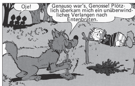
WDC 141, KA 22

Wie tief verankert in der Entwicklungsgeschichte der Ducks diese uralte Kulturtechnik des Feuerreibens ist, zeigt folgende Situation: