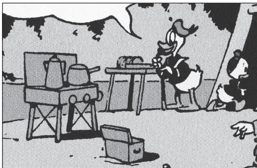
US 18, BL-OD 12

So nimmt Donald zum Camping im Bärenforst nicht nur eine elektrisch heizbare Kaffeekanne mit – man fragt sich, wo der Strom herkommt, vielleicht steht hinter dem Zelt ein Generator oder ein Sonnenkollektor? Auch einen stufenlos verstellbaren Komfort-Liegestuhl hält er für unverzichtbar – von einem Geigerzähler ganz zu schweigen.