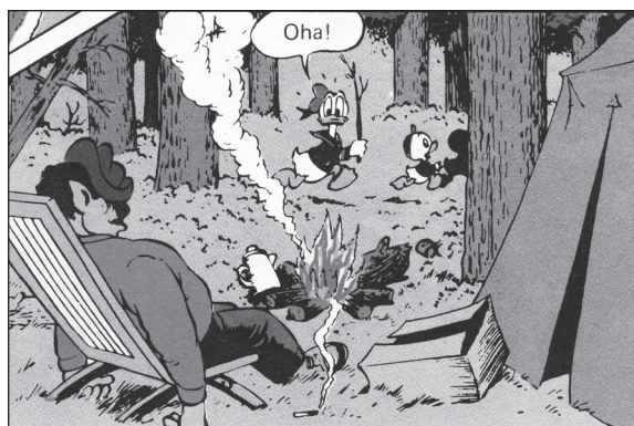
VP 1, KA 12

Es geht darin, wie in jedem klassischen Western, um die Auseinandersetzung zwischen Gut und Böse, verkörpert durch den Sheriff und den Schurken. Die Konfrontation von Gut und Böse wird hier aber auf engstem Raum vorgeführt: der Sheriff und der Schurke sitzen gewissermaßen im gleichen Zelt. Anders als Blacksnake McQuirt in „Der Sheriff von Bullet Valley“ oder der Brandstifter in der Teufelsschlucht stehen die Bösewichte in „Männer, die in Zelten zündeln“ nicht außerhalb oder am Rande der ehrbaren Gesellschaft. Es sind keine