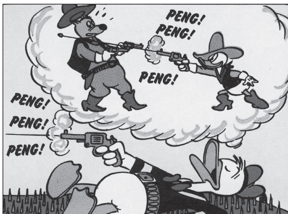
WDC 89, KA 25

Der „Geist des Westens“ jedoch ist im historischen Gedächtnis der Ducks tief verankert.