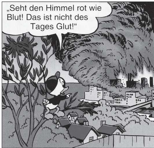
FC 108, KA 54

Der Schluss liegt nahe, dass die Angst vor der zerstörerischen Macht des Feuers im Bewusstsein der Entenhausener ebenso tief verankert ist wie das Wissen um seine wohltätige Macht.