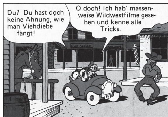
FC 199, TGDD 66

Zwei Dinge erfüllen, das scheint seine Körpersprache auszudrücken, sein Gemüt mit Bewunderung und Ehrfurcht: „Der bestirnte Himmel über mir und das Gesetz des Westens in mir“. 3