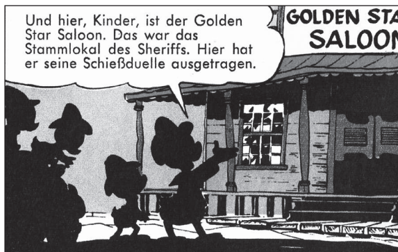
WDC 176, TGDD 16

zwischen der virtuellen Welt des Kintopps und dem Ernst des Lebens zu unterscheiden.