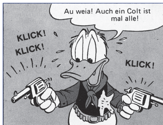
FC 199, TGDD 66

Mag sein, dass Donald sich die ganze Zeit während dieses gefährlichen Abenteuers wie in einem Film fühlt – aber dass er Colt, Lasso und Westergaul richtig einzusetzen vermag, und dass er in der Lage ist, nach einigen entschuldbaren Pannen –