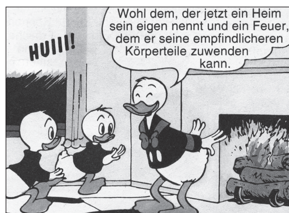
WDC 216, TGDD 99

Während ZELT also ein entschieden positiv konnotierter Begriff ist, ist ZÜNDELN ambivalent. Im Wilden Westen gehört offenes Feuer zum Alltag. Es ist Licht- und Wärmequelle, es wird zur Arbeit und zum Kochen genutzt. Vielleicht, so die naheliegende (und natürlich zu widerlegende) Vermutung, hat Erika Fuchs das Wort „zündeln“ nur als knappe und schön stabreimende Alternative für „Feuer machen“ gewählt. Das führt zu der Frage: Wie halten die Ducks es mit dem Feuer?