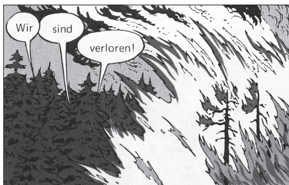
VP 1, KA 12

Ein entsprechend positives Image hat der Beruf des Feuerwehrmannes. Mit Lappen und Löschfahrzeug bekämpft er Schadfener vom Rasenbrand bis zum Großfeuer. Heldentaten gehören zum Berufsbild; Orden und Ehrenzeichen können im Laufe eines Berufslebens ganze Truhen füllen.