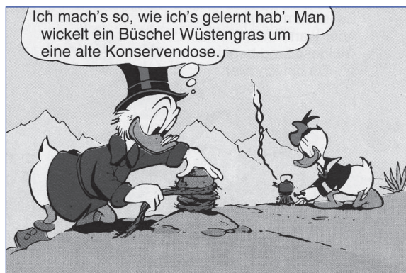
WDC 207, KA 38

Die Kunst, ein Feuer zu entzünden und zu unterhalten, gehört zu den Alltagsfertigkeiten der Familie Duck – und zwar nicht nur der jugendlichen Pfadfinder.