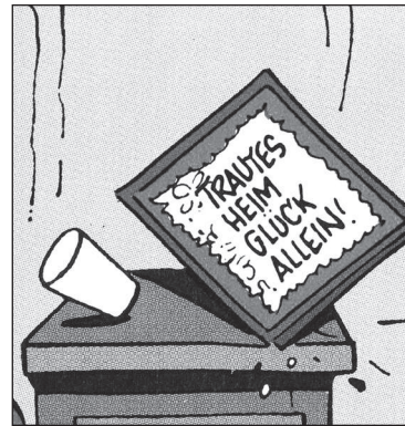
WDC 289, KA 55

Ähnliche Beispiele gibt es viele. Ohne ins Detail zu gehen, kann man sagen: Das Zelt der Ducks unterscheidet sich vom Eigenheim eigentlich nur dadurch, dass seine Wände aus Stoff sind statt aus Brettern. Das Zelt ist ihnen Haus und Behausung, eine Heimstätte, in der das Motto „Home sweet home“ an der Wand hängen könnte – bzw. in den Worten von Erika Fuchs: „Trautes Heim, Glück allein“.