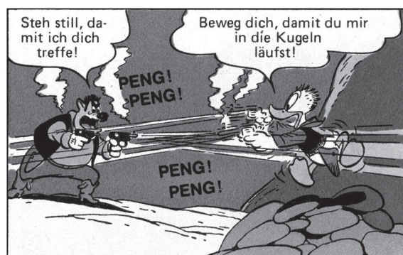
FC 199, TGDD 66

In diesem Moment wandelt sich Donald vom Wildwestfilm-Gucker zum Westmann, der am Ende in der Lage ist, den Viehdieb zu fangen.