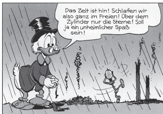
SF 2, BL-OD 21

Das Schlafen unter freiem Himmel ist unter den Ducks allerdings die Ausnahme.