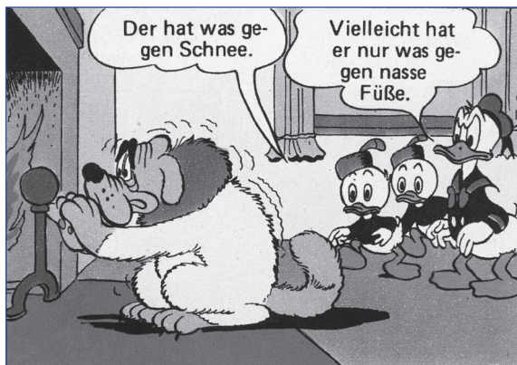
WDC 125, TGDD 80